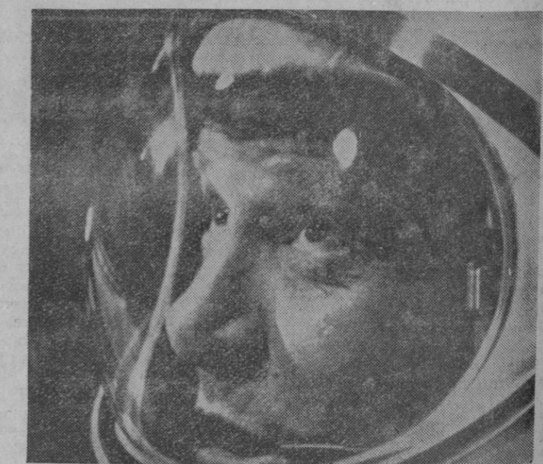
Cabo Kennedy (Florida).—He aquí al capitán Walter Schirra, embutido en su traje espacial y ocupando su puesto en la cápsula "Gemini 6", observando a través de un circuito cerrado de TV el lanzamiento del cohete "Agena", que fracasó e hizo imposible el lanzamiento de la "Gemini 6" al espacio.

Todo parece indicar, que los cosmonautas Fedosenko, Ussynskin y Wasenko «no regresaron de su misión», y que sus cadáveres continúan en órbita alrededor de la Tierra.