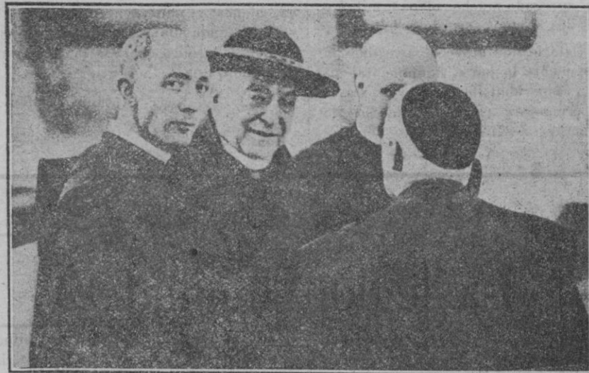
El arzobispo preconizado de Milán, P. Ildefonso Schuster, que ha sido creado cardenal en el último consistorio secreto, al cual asistieron veinte cardenales.