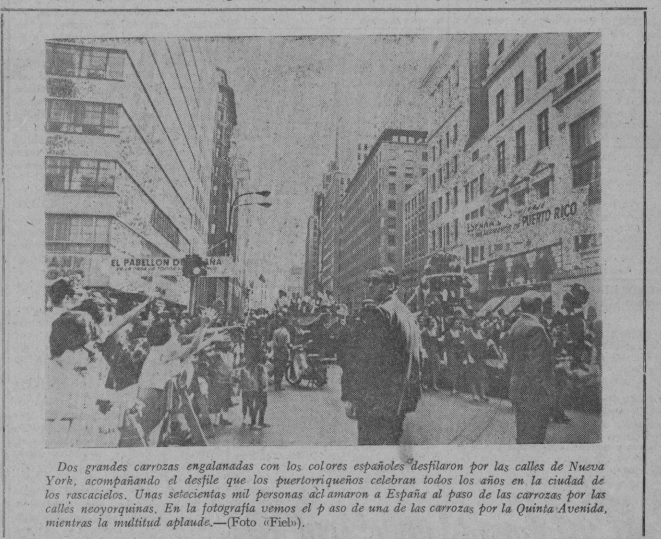
Los grandes carros engalanados con los colores españoles desfilan por las calles de Nueva York, acompañando el desfile que los puertorriqueños celebran todos los años en la ciudad de los rascacielos. Unas setecientas mil personas aclamaron a España al paso de las carrozas por las calles neoyorquinas. En la fotografía vemos el paso de una de las carrozas por la Quinta Avenida, mientras la multitud aplaude.—(Foto «Fiel»).

Existe un día para conjugar el verbo DAR, es el 17 de junio, DÍA NACIONAL DE CARIDAD.