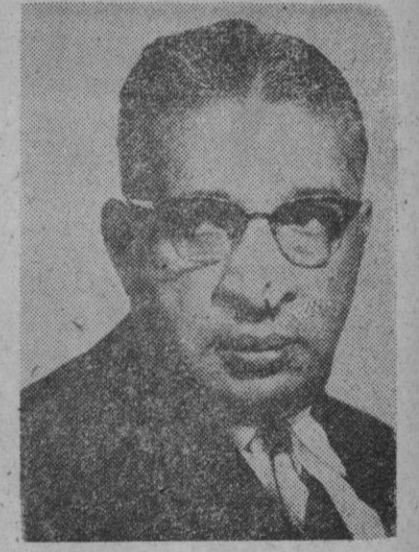
Dudley Senanayake, nuevo primer ministro de Ceilán