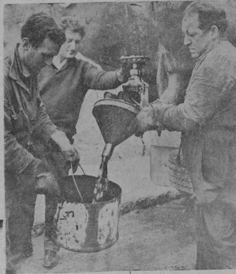
Santurce.—Estas son las primeras fotografías obtenidas del oro negro español, aparecido en La Lora en junio del año pasado. Los trece mil litros llegados a Santurce proceden del pozo número cinco. En los depósitos de la CAMPSA de esta villa se encuentran ya seiscientos mil litros de petróleo.

Moscú, 17.—La Unión Soviética cuenta con más de quince millones de aparatos de televisión y con unas quinientas emisoras televisoras, según informa un funcionario del ministerio soviético de Comunicaciones en nota difundida por la agencia oficial informativa, «Tass».—Efe.