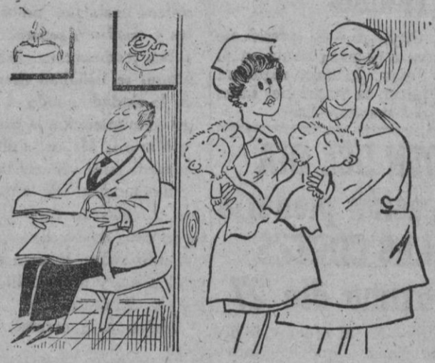
—Enseñales de uno en uno, será menor la impresión...