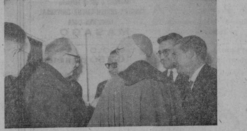
La dirección del sanatorio "UNION PREVISORA SEGOVIANA" conversando con el señor obispo y el jefe provincial de Sanidad