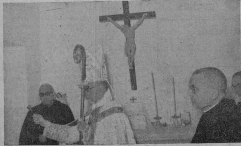
El reverendísimo señor obispo de Segovia durante el acto de bendición de la nueva capilla del sanatorio