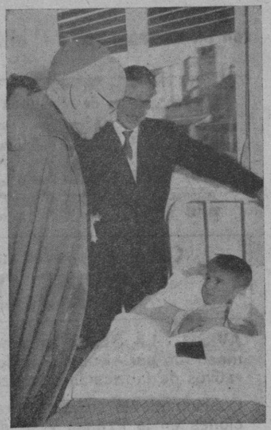
Visita a los enfermos. Nuestro prelado se interesa por un pequeño que convalece en el sanatorio

La propia empresa de seguros está dirigida por los mismos médicos que la atienden