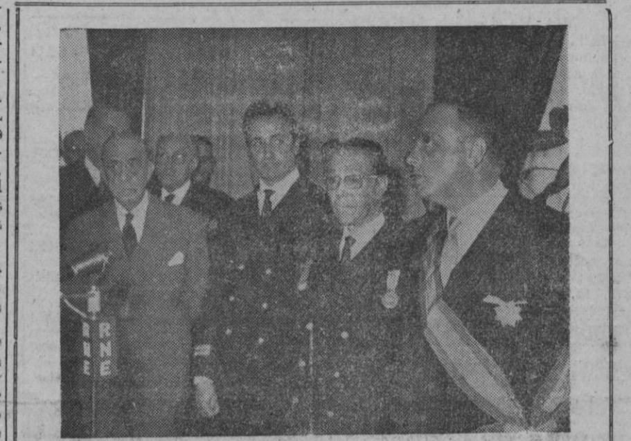
El ministro de Información y Turismo, don Manuel Fraga Iribarne, pronunciado unas palabras de agradecimiento tras haberse impuesto el ministro de Marina, almirante Nieto Antunez, la medalla del Mérito Naval.

Saigón, 9.—Los dirigentes civiles y militares survietnamitas, han firmado hoy un acuerdo formal, para resolver la crisis gubernamental, que dura ya desde hace tres semanas. Bajo los términos de este acuerdo, el Gobierno civil tiene plenos poderes, el jefe del Estado ejerce el legislativo y será convocado un congreso nacional tan pronto como sea posible.—Efe.