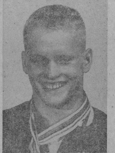
Don Schollander, nadador norteamericano que consiguió cuatro medallas de oro en los Juegos Olímpicos de Tokio y que por los periodistas del deporte del mundo entero ha sido designado como el mejor deportista del año 1964.

En el aeropuerto fue cumplimentado el ministro por el gobernador civil, presidente de la Diputación, alcalde de la ciudad, delegado de Información y Turismo y otras personalidades.