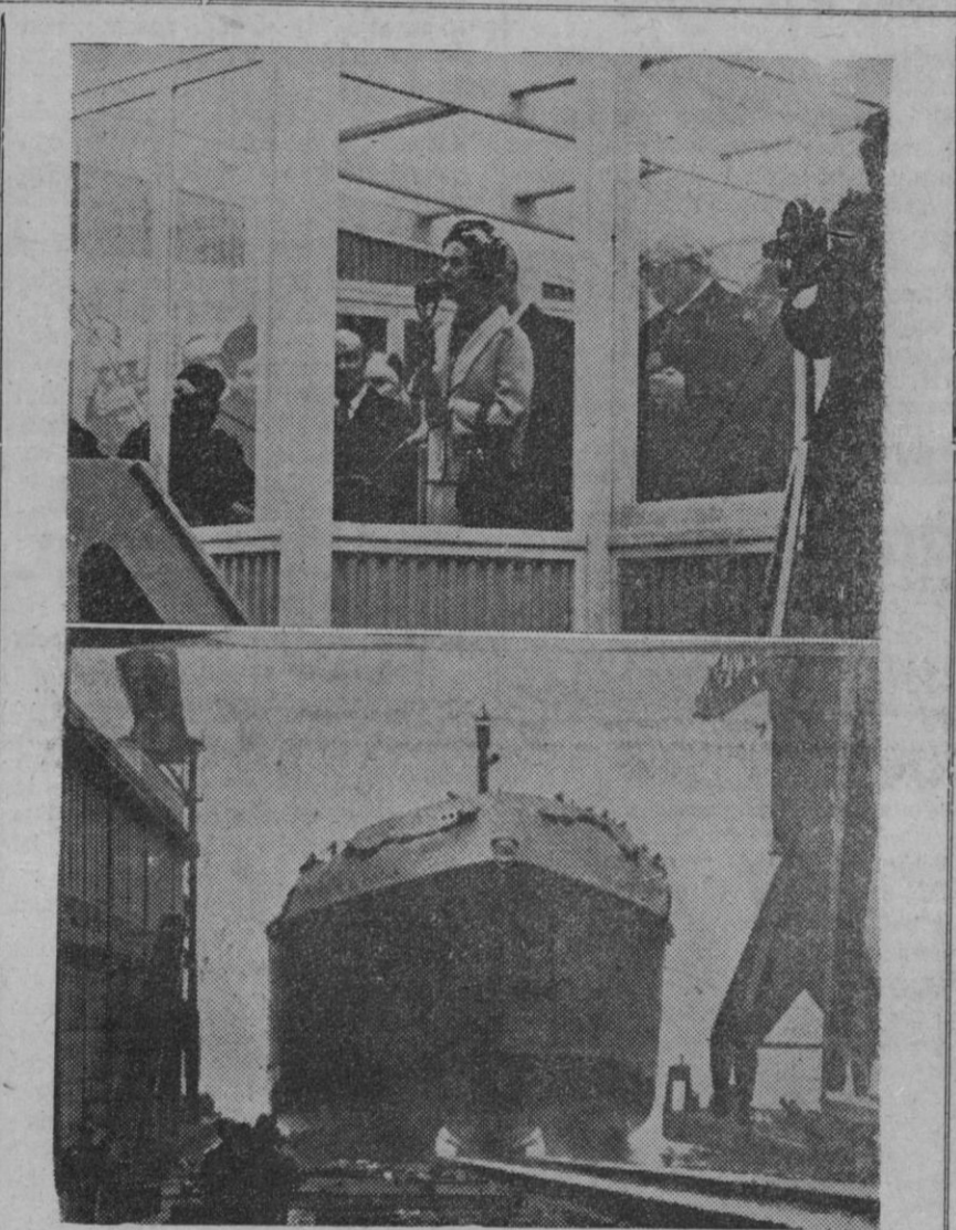
Hoboken (Bélgica).—La reina Fabiola ha presidido la ceremonia de botadura del petrolero que lleva su nombre y que se ha construido en los astilleros de esta ciudad. En la composición fotográfica, arriba, la Reina de los belgas pronunciando una alocución con motivo del acto; abajo, el "Reina Fabiola" en el momento de entrar en la mar.

Madrid, 28.—A las nueve y cuarto de la mañana llegó a Madrid, de regreso de los Estados Unidos, el ministro de Información y Turismo don Manuel Fraga Iribarne. Le esperaban en el aeropuerto de Barajas el ministro de Marina, almirante Nieto Antúnez; el subsecretario y directores generales de su Departamento, el director general de Asuntos de América del Ministerio de Asuntos Exteriores, y representantes de la Embajada de los Estados Unidos en Madrid, así como su esposa e hijos.