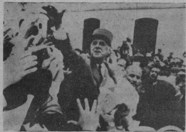
El presidente De Gaulle estrecha las manos de innumerables personas que las tienden para saludarle, durante su reciente visita a Lima, en su gira por los países de Hispanoamérica.

Un portavoz del periódico ha declarado que todo el equipo de este periódico «Telefacsimil» ha sido diseñado por una empresa de Chicago (Estados Unidos), pero será utilizado por primera vez en el Japón.—Efe.