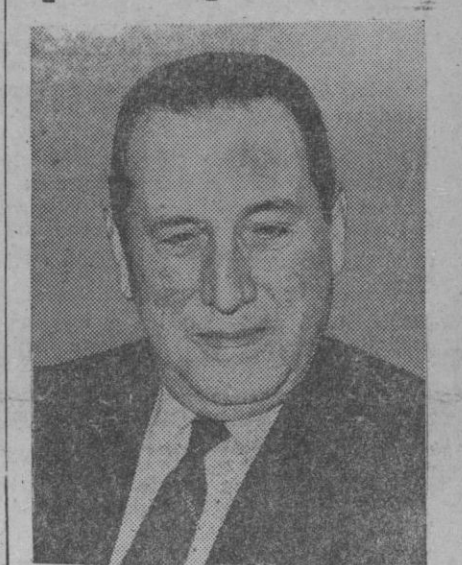
El expresidente argentino Juan Perón

Buenos Aires, 2.—Se ha producido una nueva división en la Confederación General de Trabajadores, C. G. T., dominada por los seguidores del exiliado expresidente Perón, con motivo de la huelga de 24 horas planeada con ocasión de la llegada del presidente De Gaulle.