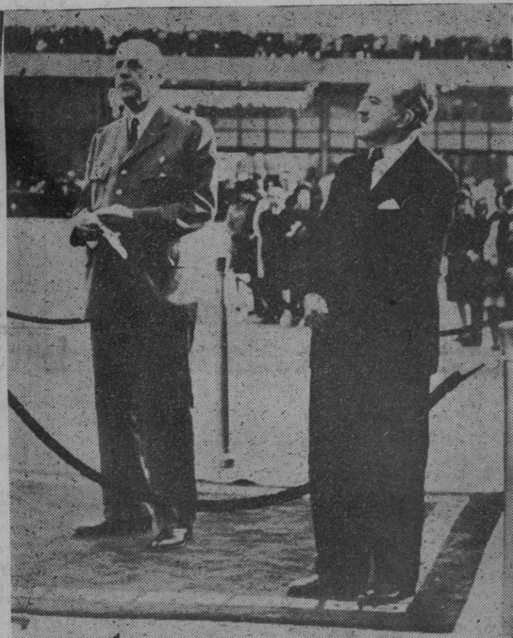
El presidente De Gaulle durante el discurso que pronunció a su llegada al aeropuerto de Bogotá, durante su actual gira por América del Sur. El presidente colombiano, Guillermo León Valencia (a la derecha), terminó por su parte su discurso de recepción con un estentóreo "¡Viva España!"

Manchester (Inglaterra), 2.—Estados Unidos y Gran Bretaña han redactado un proyecto de tratado con objeto de impedir la proliferación de las armas nucleares y en el que podía participar la China comunista, según ha declarado el primer ministro británico. Al anunciar este proyecto de tratado en un discurso electoral pronunciado en Manchester, el "premier" británico dijo que tenía la esperanza de que se unieran al tratado Rusia y Francia.—Efe.