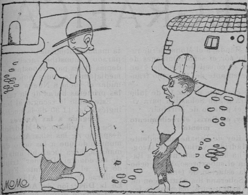
LO PRIMERO ES LO PRIMERO

El chico.—Padre: que madre se ha puesto mala. El padre.—¡Vaya por Dios! El chico.—Y la mula también. El padre.—Pues vete corriendo a casa del veterinario.