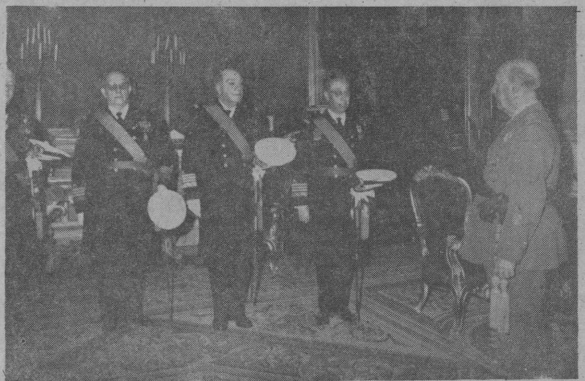
Madrid.—En el Palacio de El Pardo, el Jefe del Estado, Generalísimo Franco, ha recibido en audiencia militar a una comisión de admirantes y jefes de la II Promoción del Cuerpo General de la Armada, con motivo de celebrar la misma sus Bodas de Oro con la Marina de Guerra. En la foto, un momento de la audiencia.

Madrid, 17.—El presidente de las Cortes, señor Bilbao, ha manifestado a los periodistas, que había recibido un proyecto de ley del Ministerio de la Gobernación sobre condecoraciones policiales.—Gifra.