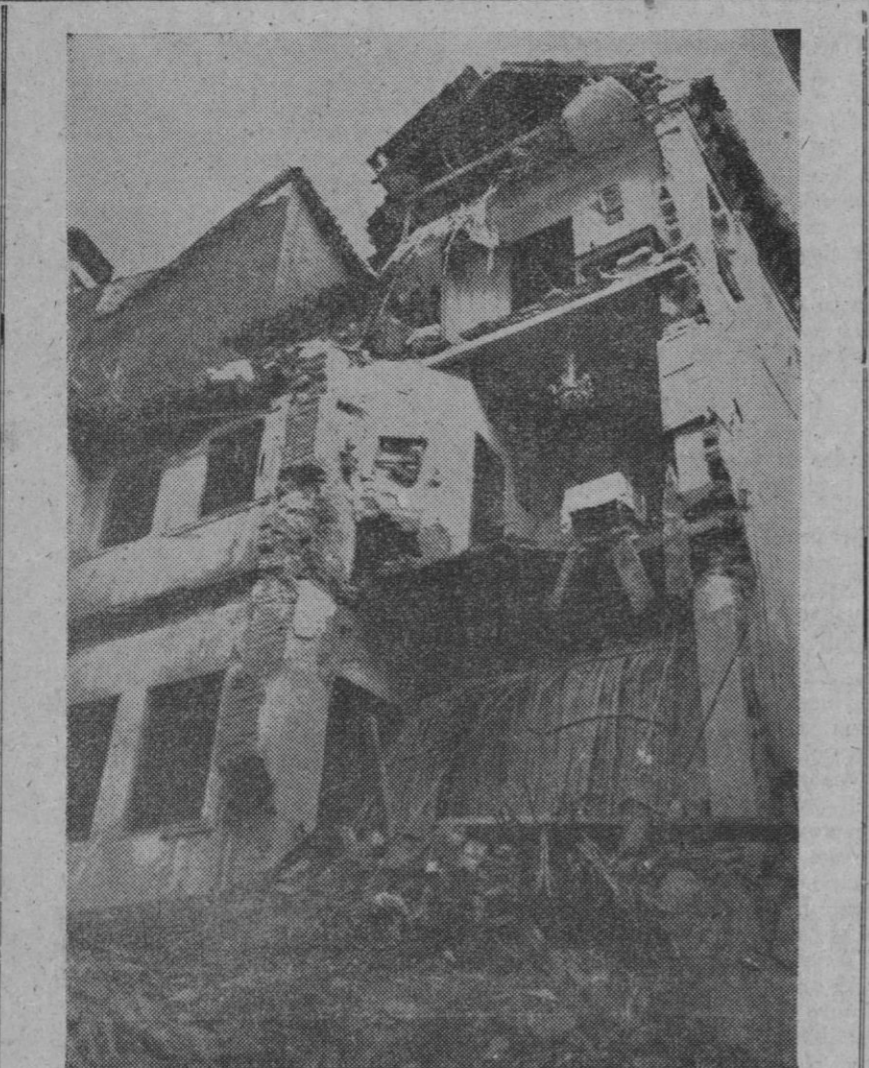
Granada.—Un temblor de tierra no muy intenso se ha notado en la ciudad. Aunque no ha habido daños de gravedad, el seísmo se hizo notar en los pisos altos de la ciudad. Una casa, en la calle Varela núm. 3, se derrumbó como consecuencia del seísmo, pero sus habitantes ya habían desalojado el inmueble, debido a su mal estado. En la foto, un estado de la casa después de su derrumbe.

La visita de la Reina a Alemania vendría a cumplir la misión inglesa de correspondencia a la visita que en 1958 realizó el presidente alemán Theodor Heuss a Inglaterra.—Efe.