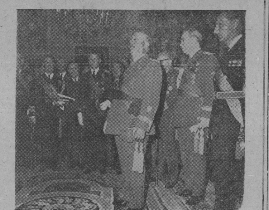
Madrid.—Con motivo de la Pascua Militar, el Jefe del Estado, Generalísimo Franco, recibió en el Palacio de El Pardo a una nutrida comisión de la que formaban parte los ministros de los tres Ejércitos y otros altos mandos militares. En la fotografía un momento del acto.

Miami (Estados Unidos), 8.—Dirigentes cubanos en el exilio han acusado a Inglaterra de «perfidia» y piden que se lleve a cabo un boicot contra mercancías inglesas importadas por Norteamérica como medida de represalia contra la venta a Cuba de autobuses británicos y accesorios de los mismos.