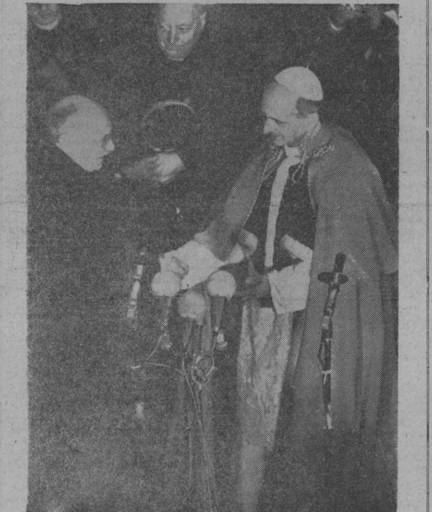
Jerusalén (Israel).—Su Santidad el Papa Pablo VI durante su discurso pronunciado en la puerta de Mandelbaum, al despedirse de las autoridades israelitas el domingo por la noche. A su lado, el presidente Shazar.

«Su nivel de vida—añade el boletín del Chemical Bank New York Trust Company—se eleva rapidísimamente, los aumentos de sueldos y salarios rebasan los de veinte años de austeridad, termina diciendo este Banco norteamericano en su publicación.—Efe.