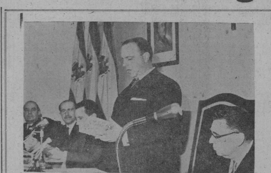
Madrid.—En el aula magna de la Escuela Oficial de Periodismo y presidida por el ministro de Información y Turismo, señor Fraga Iribarne, se ha celebrado la solemne sesión de apertura del curso. Haciendo entrega de los títulos a los nuevos periodistas de honor. En lo foto, una vista de la presidencia.

Asistieron más de quinientos oficiales de la Marina Mercante.—Cifra.