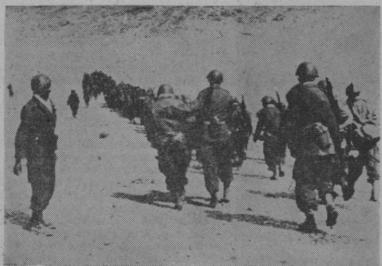
Figuiú (Marruecos).—Una columna del Ejército real marroquí se dirige hacia la ciudad de Figuiú, centro de los más violentos combates contra los argelinos. Aunque parece que éstos ya han cesado.