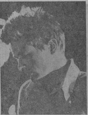
James Dean sigue, años después de su trágica muerte, teniendo influencia en el cine americano

El cine americano pretende hacer triunfar con ellos el mito de James Dean