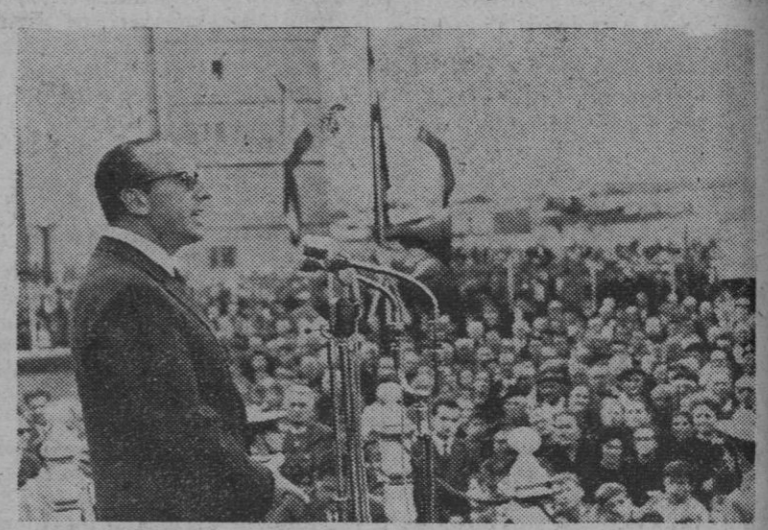
En el Poblado de Casilda de Bustos, de la barriada de Carabanchel, en Madrid, el ministro de Trabajo, don Jesús Romeo Gorria, colocó la primera piedra para la construcción de mil quinientas nuevas viviendas. Después pronunció un importante discurso dirigido a los afiliados a la Mutualidad Laboral de la Construcción. En la foto, el ministro durante su discurso.

Rabat, 31.—Marruecos ha decidido romper sus relaciones con Cuba y llamar a sus embajadores en la R. A. U. y Siria. La ruptura con Cuba obedece a los envíos de armas y voluntarios a Argelia para luchar contra Marruecos, y en cuanto a la llamada de embajadores señala que la misma obedece a la actitud adversa de los respectivos Gobiernos con motivo del conflicto actual. Unos 350 profesores egipcios en Marruecos han recibido orden de dar por finalizadas sus actividades, debiendo regresar a su país inmediatamente. Por otra parte, Marruecos ha enviado una delegación oficial a Argel para asistir mañana a las fiestas conmemorativas de la revolución argelina, delegación que preside el ministro de Trabajo y Asuntos Sociales, señor Beyaún.