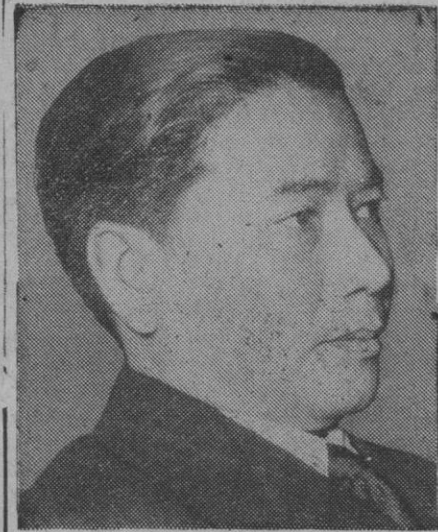
Ngo Dinh Diem, presidente católico del Vietnam del Sur, a quien su pretendida intransigencia con los budistas ha costado la pérdida del poder con el golpe de estado producido hoy

Las tropas insurgentes ocupan todos los edificios gubernamentales de Saigón, menos el palacio presidencial, donde se desarrollan violentos combates