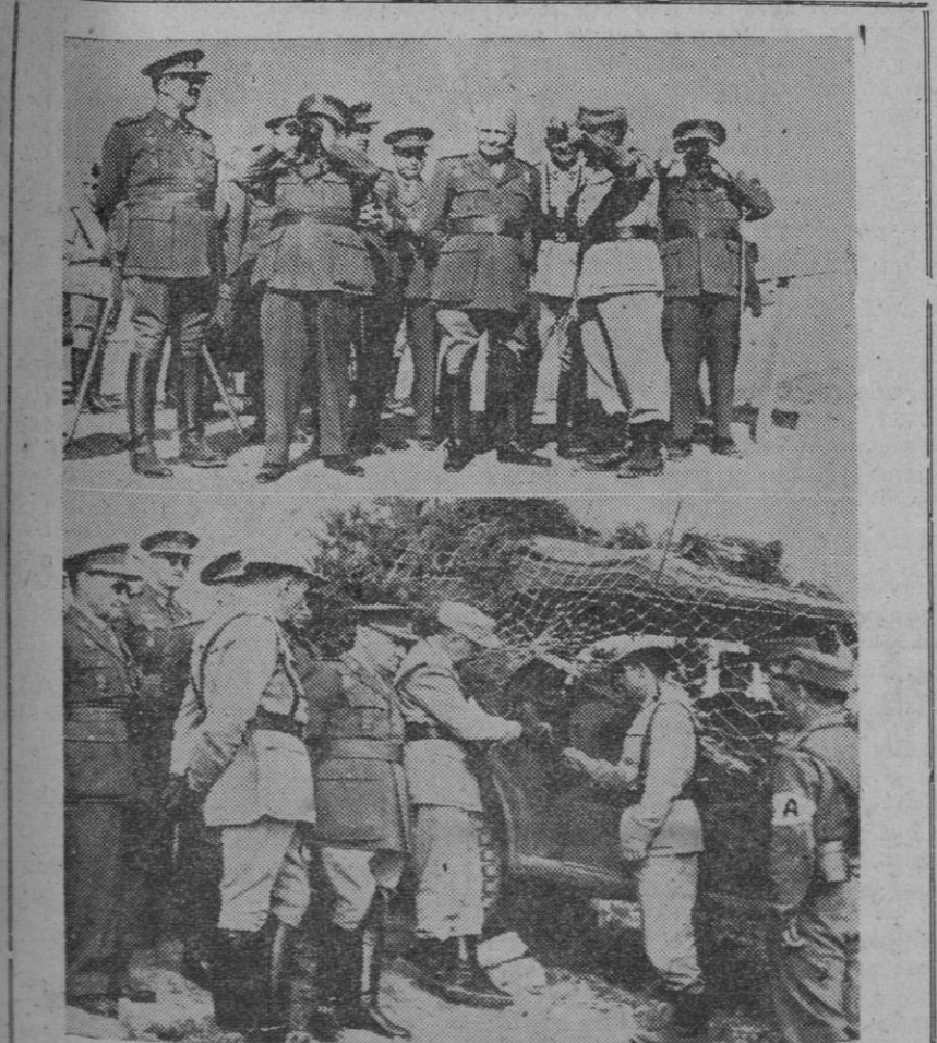
El ministro del Ejército, teniente general don Pablo Martín Alonso, acompañado del director general de Enseñanza Militar, ha presenciado unas maniobras de los alféreces-alumnos en el campamento de San Gregorio (Zaragoza). Al final de las mismas, el ministro pronunció un discurso.

Tánger, 1.—Se informa oficialmente que la artillería pesada, y los morteros del Ejército argelino, bombardean incesantemente desde esta madrugada, la ciudad marroquí de Figuig, situada a 50 kilómetros al sur del puesto fronterizo de Ich, y que parece haber sido cercado por las fuerzas argelinas. También se ha registrado otro fuerte ataque argelino, contra el puesto marroquí de Mengub, importante centro de comunicaciones, situado a 50 kilómetros al oeste de Figuig, en la carretera entre esta ciudad y Kear es Suk.—Efe.