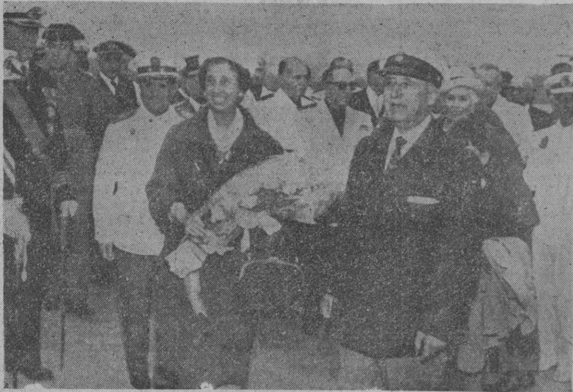
Procedente de San Sebastián y a bordo del yate "Azor", llegó a La Coruña el Jefe del Estado acompañado de su esposa y sus nietos. En la telefoto, ya en el puerto de La Coruña, después de haber desembarcado.—(Telefoto Europa Press.)

Moab (Estado de Utah, Norteamérica), 30.—Otros cinco mineros han sido hallados vivos en la mina de portasio de esta localidad, donde se encontraban sepultados desde el martes—a una profundidad de 900 metros.—Efe.