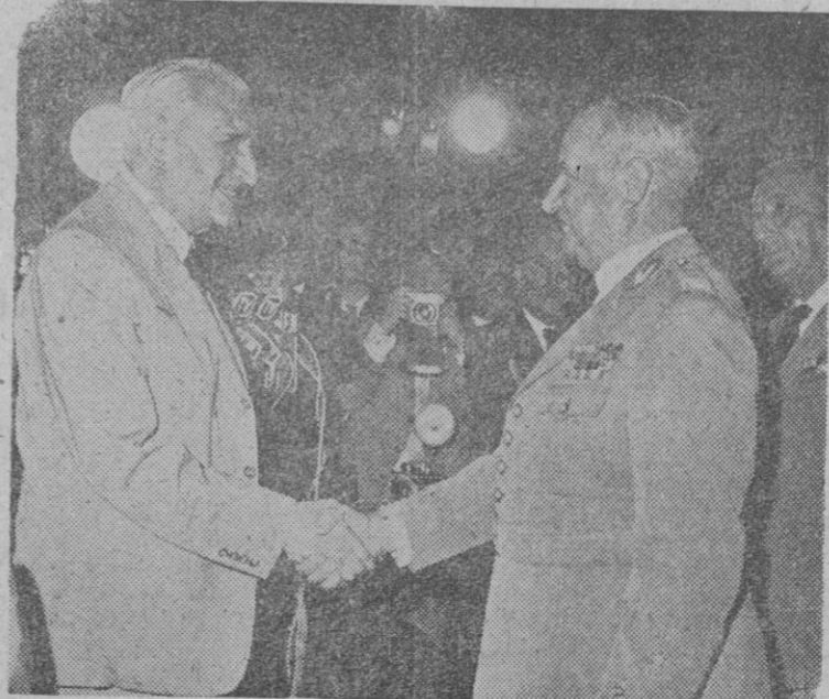
Un general del Ejército portugués estrecha la mano del presidente del Consejo de ministros, doctor Oliveira Salazar, en el acto de adhesión de las fuerzas armadas a la política ultramarina del Gobierno. Quinientos representantes del Ejército, la Marina, la Aviación y las Fuerzas de Seguridad, cumplieron al jefe del Gobierno en el Salón de los Pasos Perdidos, en el Palacio de la Asamblea Nacional de Lisboa.

El monumento, que se construye a iniciativa del Ayuntamiento de Santurce, quedará instalado en dicha localidad para el día de Nuestra Señora de la Merced del próximo año.