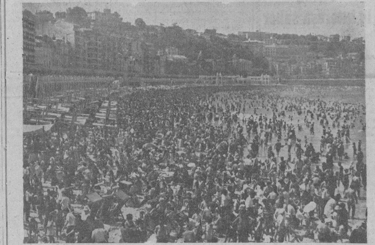
Las vacaciones veraniegas están en su apogeo. Unos buscan la soledad de los pueblecitos o las playas perdidas; otros, los tradicionales centros veraniegos de moda, atiborrados de veraneantes. En la foto, la playa de La Concha, de San Sebastián, en estos días. Los supuestos bañistas cubren por completo la arena de la playa.

Esta es la primera vez que este país concede la extradición de un ex-jefe de Estado de un país extranjero. Efe.