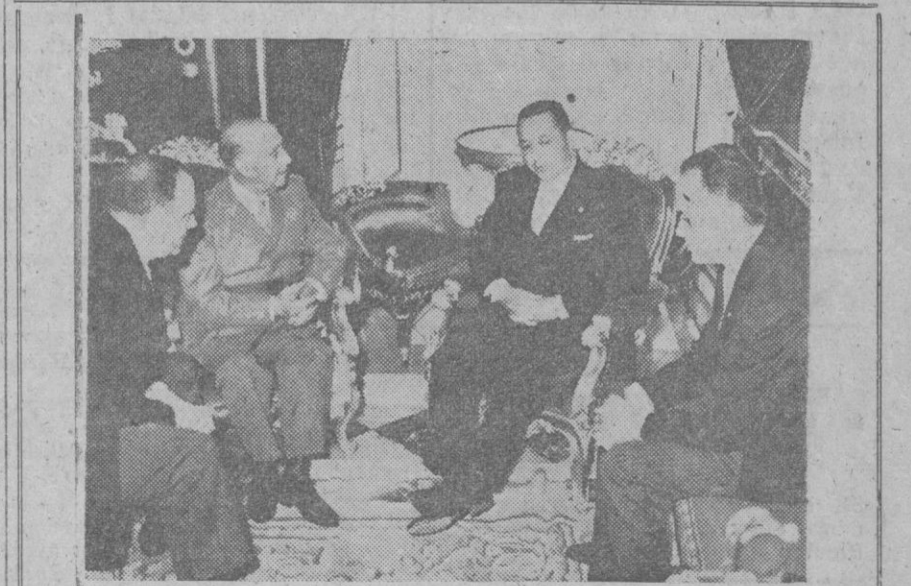
Su Excelencia el Jefe del Estado recibió en audiencia, en el palacio de El Pardo, al ministro marroquí de Información y Deportes, Abdelhadi Boutaleb, quien iba acompañado del ministro español de Información y turismo, don Manuel Fraga Iribarne. En la foto, un momento de la audiencia.

de grandes muestras de simpatía por parte del numerosísimo público que se había congregado en las calles del trayecto. En la plaza de la Candelaria «Miss España» recibió el saludo oficial de la ciudad en la persona de su alcalde, don Joaquín Amigo de Lara, y a continuación hizo una ofrenda de flores ante el monumento a la Patrona de Canarias.