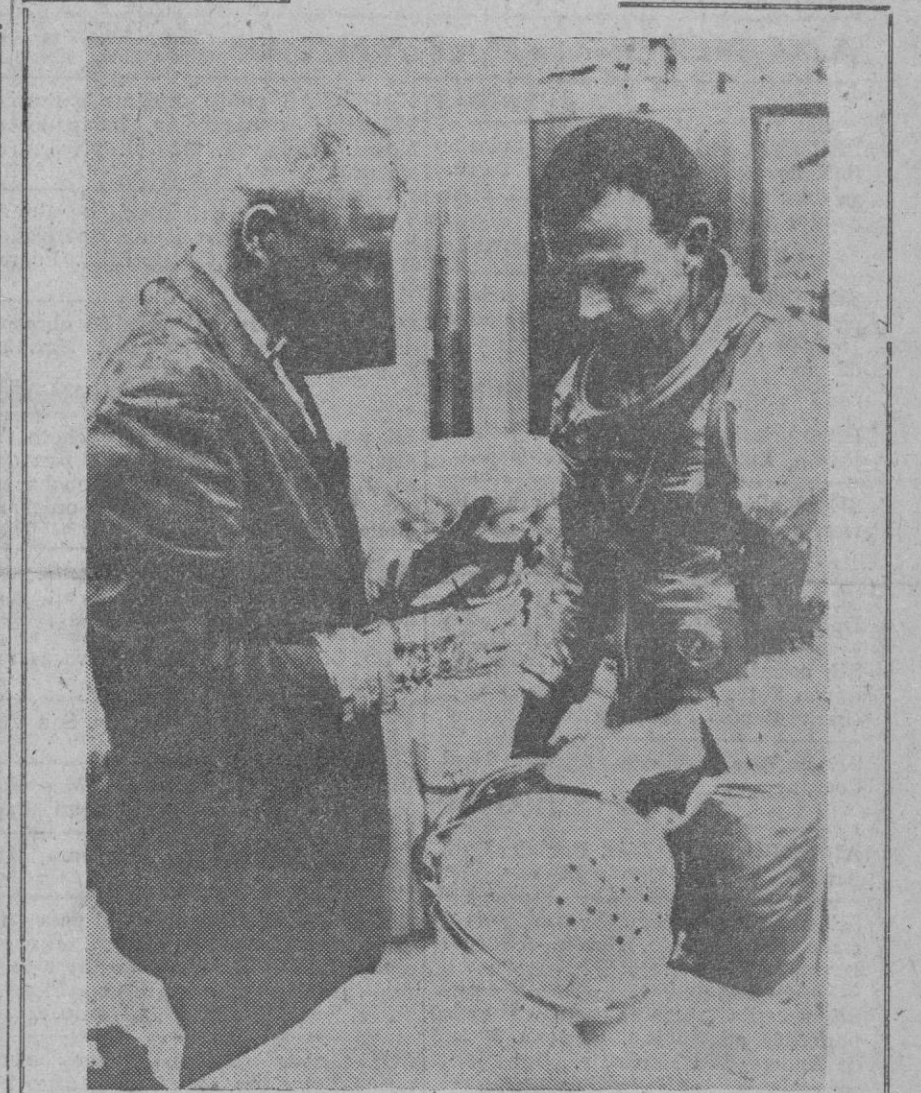
El astronauta Leroy Gordon Cooper, en un momento en que habla con su compañero John Glenn sobre el uso de los guantes y el casco, lanzado hoy al espacio, dará veintidós vueltas a la Tierra, y descenderá después en el Pacífico, cerca de las islas Midway.

Cabo Cañaveral, 15.—A los 55 segundos del lanzamiento todo iba perfectamente y un minuto veinticuatro segundos después todo era normal. A las 14,10 hora española la «N. A. S. A.» anunciaba que Cooper había entrado en órbita y éste informó que todo el sistema marchaba bien al entrar en el espacio.—Efe.