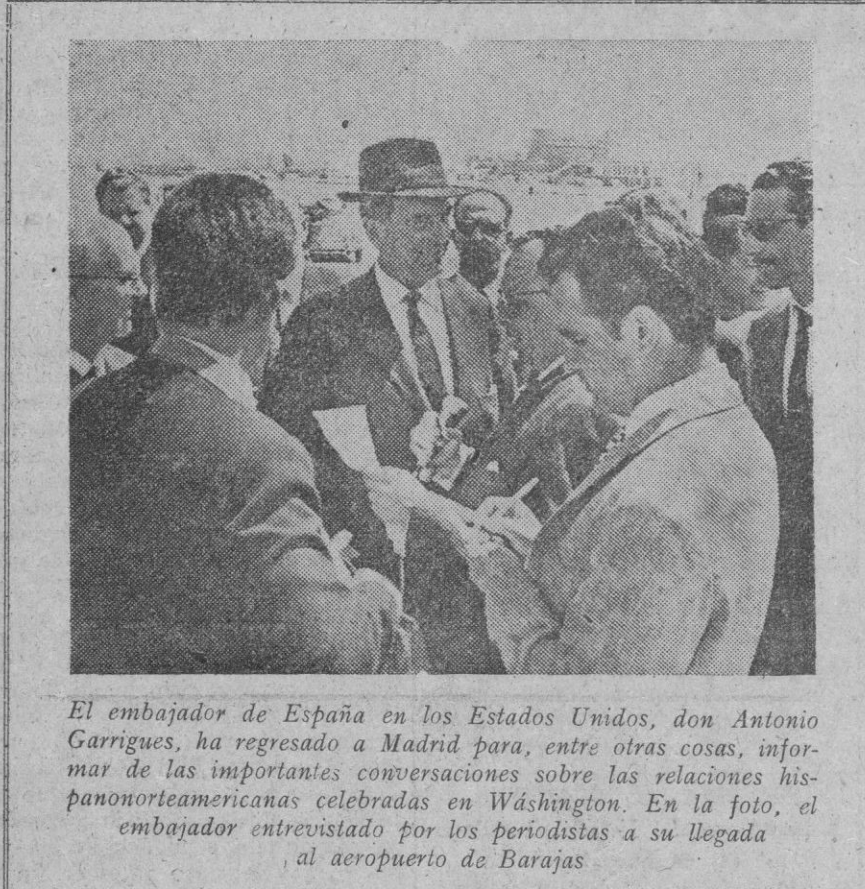
El embajador de España en los Estados Unidos, don Antonio Garrigues, ha regresado a Madrid para, entre otras cosas, informar de las importantes conversaciones sobre las relaciones hispanoamericanas celebradas en Washington. En la foto, el embajador entrevistado por los periodistas a su llegada al aeropuerto de Barajas.

a la elección de 170.000 enlaces sindicales; luego serán elegidos los vocales jurados de empresa; posteriormente los cargos de juntas sindicales locales, sindicatos provinciales, sindicatos nacionales, para, finalmente, elegir 180 procuradores en Cortes, la tercera parte de cada Municipio, las representaciones del Consejo del Reino, Consejos de Estado y Economía, etcétera, etc. Es decir, que al finalizar el año habrá 400.000 representantes.—(Continúa en la página 4)