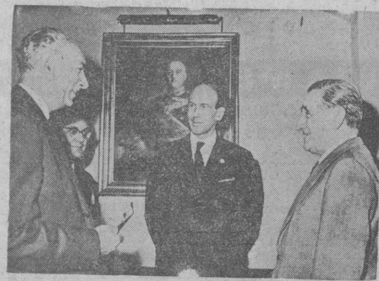
Durante su visita a Madrid, el ministro francés de finanzas, acompañado de su colega español, visitó al vicepresidente del Gobierno, capitán general Muñoz Grandes, quien en la foto conversa con M. Valery Giscard d'Estaing, en presencia del ministro don Mariano Navarro Rubio, en el despacho del Alto Estado Mayor del vicepresidente español.