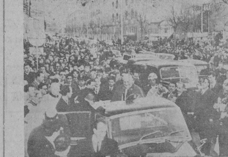
Su Santidad el Papa, aclamado en las calles del popular barrio de Roma en que se encuentra la iglesia de la Ascensión, que visitó recientemente el Papa.

Decreto por el que se aprueba la constitución de una mancomunidad formada por los Municipios de Valdeverdeja, Puente del Arzobispo, Torrijos y Coleca del Tajo (Toledo), a los fines de abastecimiento de aguas. Decreto por el que se deniega la segregación de parte del término mu-