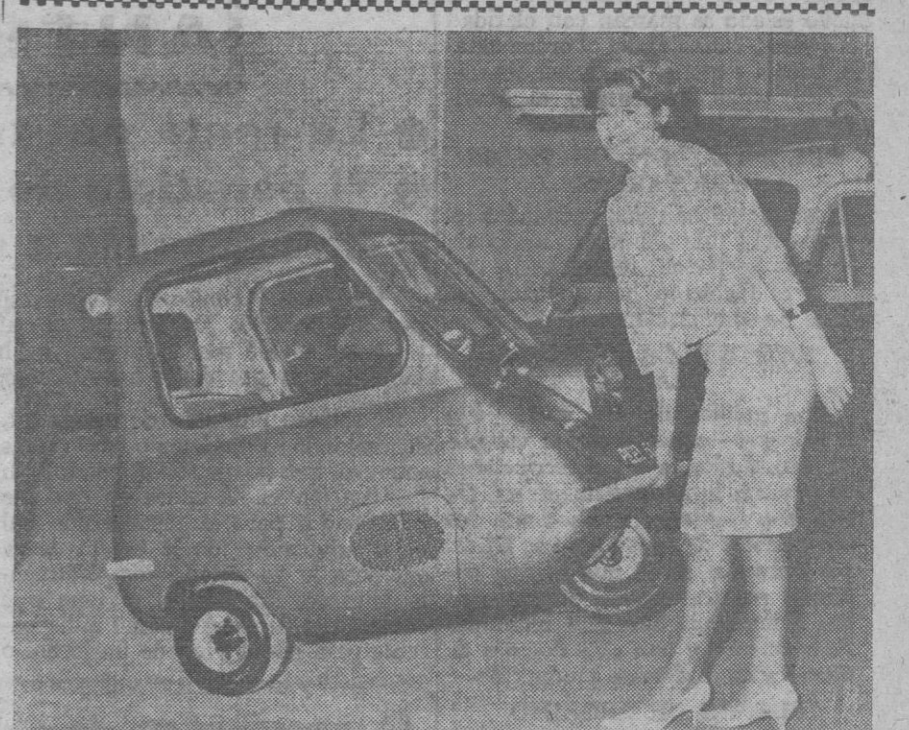
Para esta señorita no es problema el estacionarse este Peel P.50, de tres ruedas, aunque el espacio sea en extremo reducido: no tiene más que levantar y empujar. Se asegura que el Peel, de un solo asiento, es el coche más pequeño y económico del mundo. Propulsado por un motor de 50 c. c. y provisto de tres velocidades, ha sido especialmente diseñado para ofrecer la economía y los servicios propios de la motoneta o de una pequeña motocicleta, con la ventaja adicional de la protección contra la intemperie. El P.50 tiene la carrocería de fibra de vidrio, que sólo pesa 58,9 kilogramos, su longitud excede ligeramente de 1,20 metros y es ideal para utilizarlo en las ciudades de mucho tráfico. Alcanza una velocidad de 64 kilómetros por hora.

es labor de un día. Pero los primeros resultados—altamente satisfactorios—de estas obras, están en los arcos románicos descubiertos en la fachada principal y posterior. Otro bello y hermoso arco, que por la forma y bulto denota ignorados capiteles románicos, existe sin descubrir en la segunda capilla lateral derecha de la nave mayor, y que por una inscripción que hemos leído en su friso, fue sacristía independiente o fragmento de la actual, fechada en 1769, y esas pinturas murales desconocidas hasta ahora que en Madrid están y van a ser convenientemente devueltas a su pristina belleza. Antonio GOMEZ SANTOS