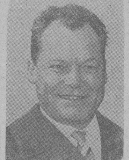
Willy Brandt, alcalde de Berlín Occidental, cuyo partido, el social-demócrata, ha logrado una resonante victoria en las recientes elecciones celebradas en Berlín