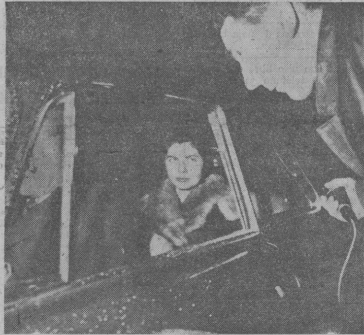
La princesa Soraya, llegó a Barcelona, en viaje de regreso de Ibiza a Ginebra. Un radioreportero persigue a la princesa hasta la puerta del hotel en que se alojó en la Ciudad Condal; pero ella se negó a hacer declaración alguna, visiblemente enojada.

Sin embargo, los miembros de la misión advierten que el creciente desarrollo de España dará lugar a una reñida competición, especialmente por parte del Mercado Común y otras zonas comerciales europeas. Esta competición se hará aún más dura cuando España se convierta —probablemente muy pronto— en miembro asociado del Mercado Común Europeo.—Efe.