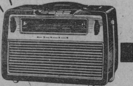
Modelo AE 3330 T (Portátil)