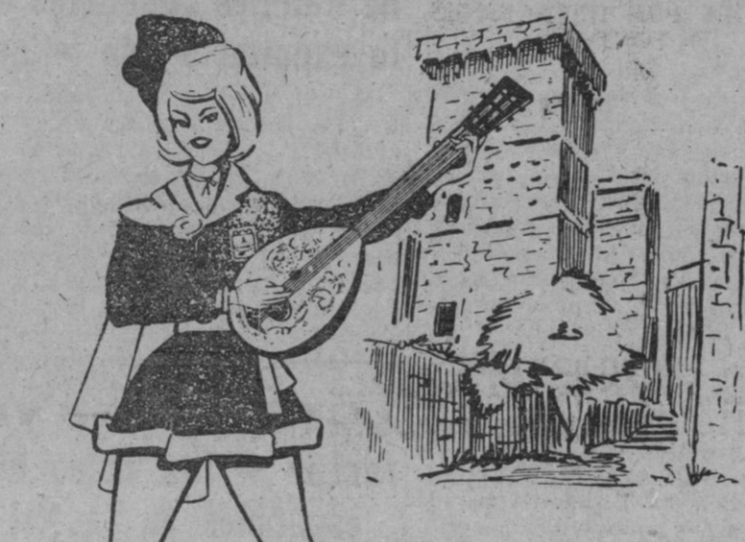
Imagen y sonido