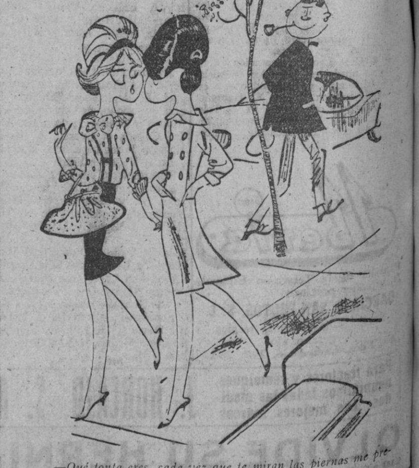
—Qué tonta eres, cada vez que te miran las piernas me preguntan si te has hecho alguna carrera...

Más capacidad - Menos precio - CASA SOLERA