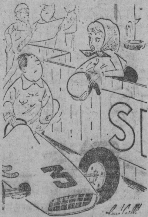
—¡...Prométeme no correr demasiado!

OPTICA DIPLOMADA ATALAYA Fdez. Ladreda, 12.