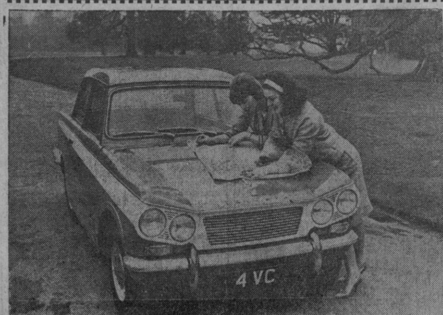
El nuevo "Triumph Vitesse 6", que se dice es el único de su clase en el mundo provisto de motor de seis cilindros, y puesto en el mercado por la Standard Triumph International británica. Basado en el exitoso "Herald", el "Vitesse 6" tiene las mismas líneas generales, aunque la sección del capot es totalmente nueva comprendiendo contornos semirredondos que incorporan faros gemelos. Se ha empleado profusamente el aluminio anodizado brillante para las partes exteriores, normalmente cromadas, y se dice que es también el primer automóvil del mundo que tiene parachoques metálicos anticorrosivos.

advierte: Que el baño de los niños debe realizarse, los tres primeros días, a temperaturas mínimas de veintidós grados.