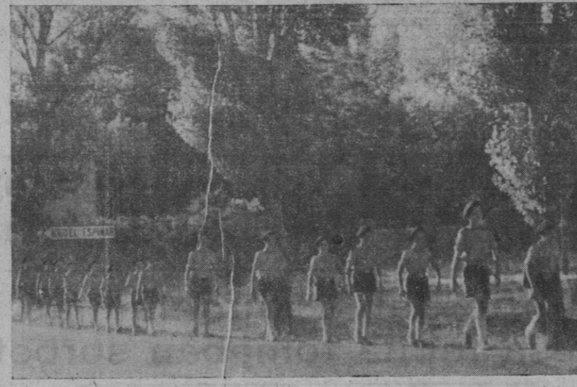
Desde el campamento de 'San Rafael', los acampados realizan frecuentes visitas culturales a parajes típicos o monumentos...