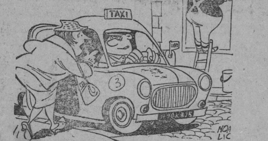
—A la plaza 4 de Agosto. —¿De qué año?

¡mejor que la realidad! modelo 1962 de 19" 18.500 ptas. CASA SOLERA