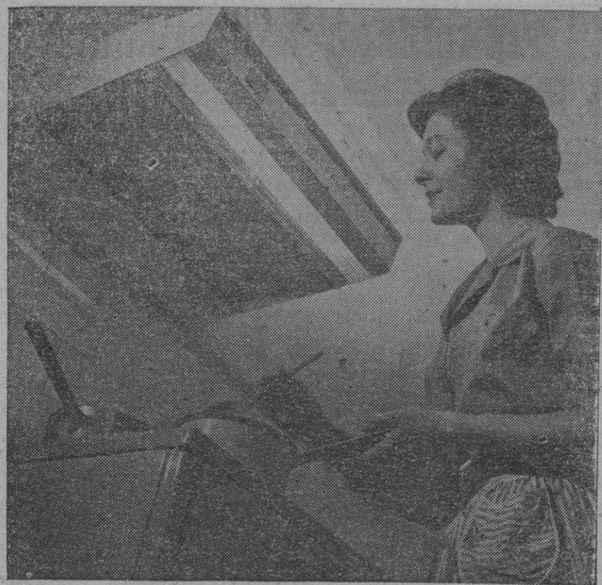
Este nuevo purificador de aire puede ser instalado sobre la cocina de gas o eléctrica para recoger las emanaciones de los guisos y renovar el aire. Tiene una especie de ventilador que absorbe los vapores, neutraliza su olor mediante un "elemento" de carbón y de madera especialmente tratado, y seguidamente pone en circulación aire purificado

En los primeros momentos jugó más el Madrid, pero después, sobre todo a partir del tanto, jugó más la Juventus. Si en lugar del conformarse con el 1-0 se lanza la delantera es muy posible que la Juventus hubiera ganado por un tanto más.—Cifra.