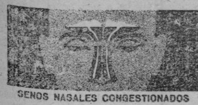
SENOS NASALES CONGESTIONADOS

¡En pocos minutos... su cabeza se despeja y durante horas... Ud. se siente aliviado!