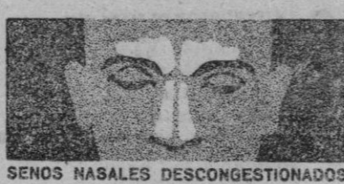
SENOS NASALES DESCONGESTIONADOS

Cuando usted se acatarrá, la congestión invade la zona crítica de los senos nasales y frontales. La congestión dificulta su respiración y origina opresión y dolor. Usted tiene la cabeza pesada, siente cansancio y fiebre.