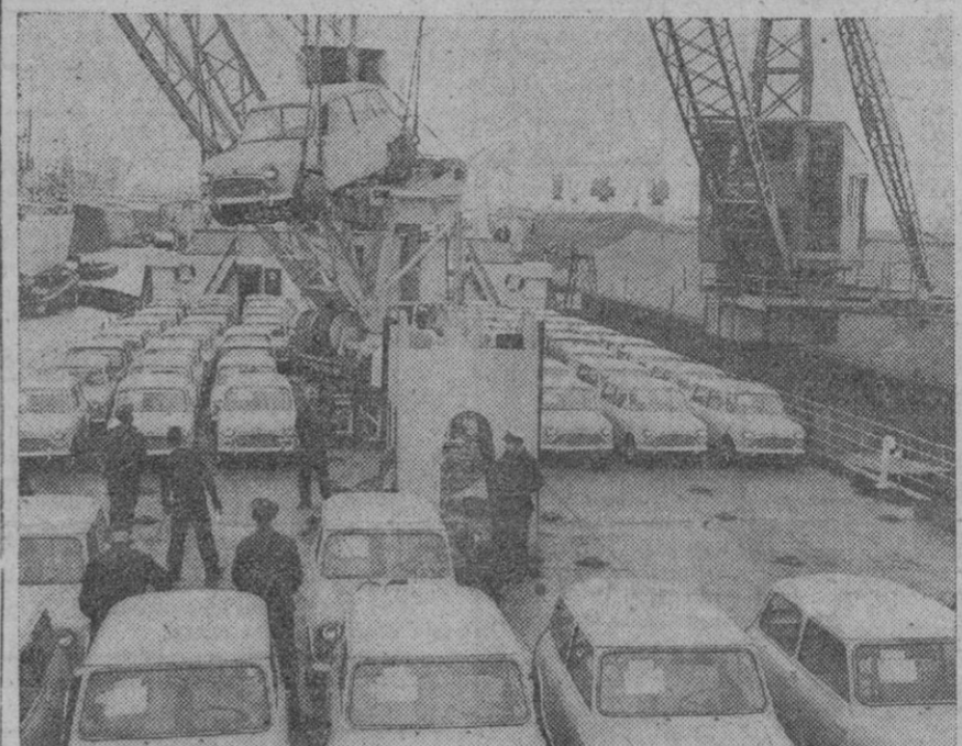
Una consignación de automóviles Austin "Seven", diminutos vehiculos que han obtenido un gran éxito desde su reciente puesta en el mercado, son cargados en un transbordador para transportarlos de Inglaterra a Holanda. Utilizando el transbordador se espera reducir los costes de transporte de los automóviles destinados al continente europeo.