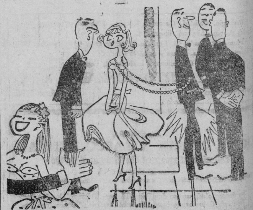
—Lo siento, pero este ballé le tengo ya reservado