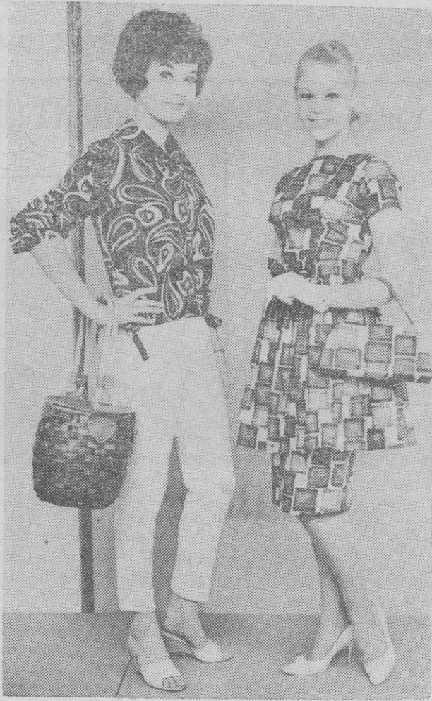
Nueva moda para jovencitas. La modelo de la izquierda luce un conjunto de pantalones blancos con blusa en estampados multicolores. La otra maniquí viste un traje de dos piezas, en algodón de rápido secado, en dos colores, con sacó haciendo juego

Desde el día siguiente de Reyes, constantemente leemos en la Prensa anuncios de casas de Alta Costura en las que, se anuncia una verdadera liquidación de las toiletas de 1960 y, es que, a estas alturas, ya nadie quiere pagar precios altos por toiletas que, dentro de escaso tiempo, pueden haber pasado a segundo término, ya que la moda, cada vez más veleidosa, hace cada año más corto su reinado para anunciar otros completamente nuevos.