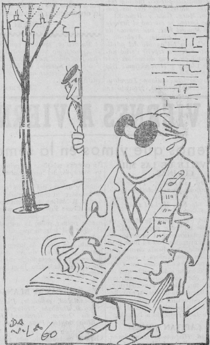
Analfabeto: Hay quien ve más que tú

Las informaciones que se tienen indican que en Kivu, controlada por autoridades lumumbistas, las fuerzas militares congoleñas hacen caso omiso de las órdenes de las autoridades gubernamentales.—Efe.