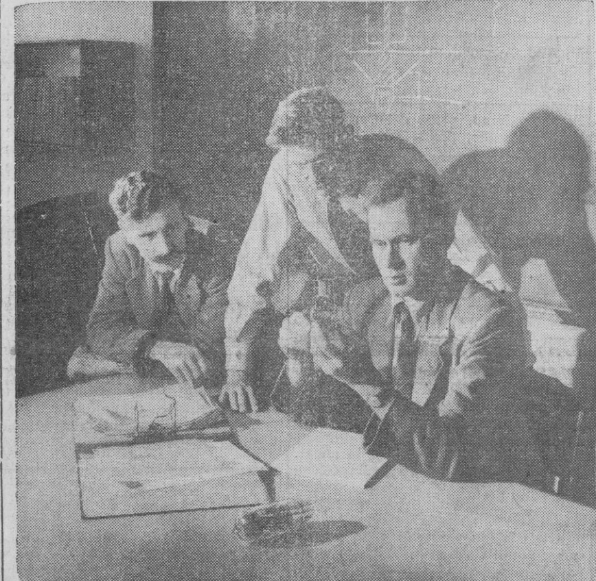
El perfeccionamiento de un tubo al vacío, de un nuevo diseño, implica la construcción de modelos experimentales de las diversas partes esencialmente competentes del tubo. He aquí, en los Laboratorios Millard, a tres hombres que ponen en común sus talentos y energías, en un esfuerzo de espíritu de equipo, para producir el mejor diseño posible de tubo al vacío

El doctor Michael Ramsay, nombrado sucesor del doctor Fisher para el cargo de primado de Inglaterra, y el doctor Frederik Coggan, designado arzobispo de York en lugar del doctor Ramsay, hablaron de dicho tema la pasada noche durante una entrevista ante las cámaras de la Televisión.—Efe.