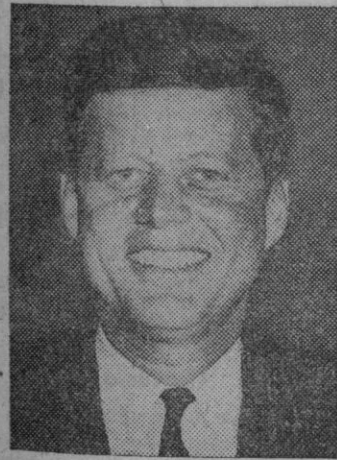
John F. Kennedy, senador norteamericano por el Estado de Massachusetts, uno de los probables candidatos a la presidencia de los Estados Unidos en las próximas elecciones de noviembre. Como es sabido, Kennedy viene obteniendo destacados triunfos en las elecciones primarias en diferentes Estados

Cuando regresaba a su casa, en bicicleta, el 13 de agosto de 1958, con un nuevo par de botas de fútbol que le habían sido regaladas, con motivo de su cumpleaños, chocó contra un coche y fue hospitalizado, permaneciendo confinado desde entonces hasta el momento de su fallecimiento.