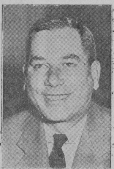
Thomas S. Gates, nuevo ministro de Defensa de los EE. UU.