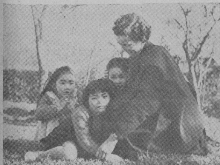
Misioneras de Cristo Jesús... nacidas hace quince años a la sombra del castillo de Javier y continuadoras desde mil novecientos cincuenta y dos de su obra apostólica en Yamaguchi, una de las principales ciudades del vicariato de Hiroshima en el lejano Japón.

La joven actriz, esposa del actor Mel Ferrer, acaba de terminar una película y ha sido aconsejada por los médicos que no acepte más papeles hasta que no dé a luz, en el mes de julio.