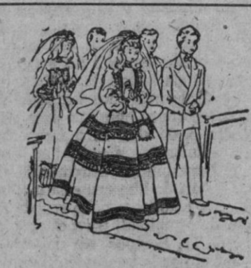
CASA GIVAJA Nuevos modelos Primera Comunión "Especialidad de esta Casa" ULTRALAS