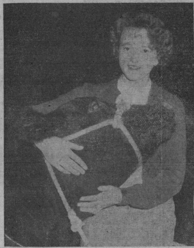
Esta señorita que aparece en esta fotografía muestra un novillo Aberdeen-Angus exhibido recientemente en una exposición en Londres

Los ganaderos a quienes, como compradores, interesen detalles sobre la composición de los piensos compuestos que se elaboran en virtud de dichos acuerdos, deben dirigirse a la Cámara Oficial Sindical Agraria de su provincia o la Junta coordinadora de la mejora ganadera.»—Cifra.