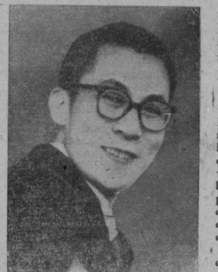
El Dalai Lama

Y dirige personalmente la situación en el Tibet