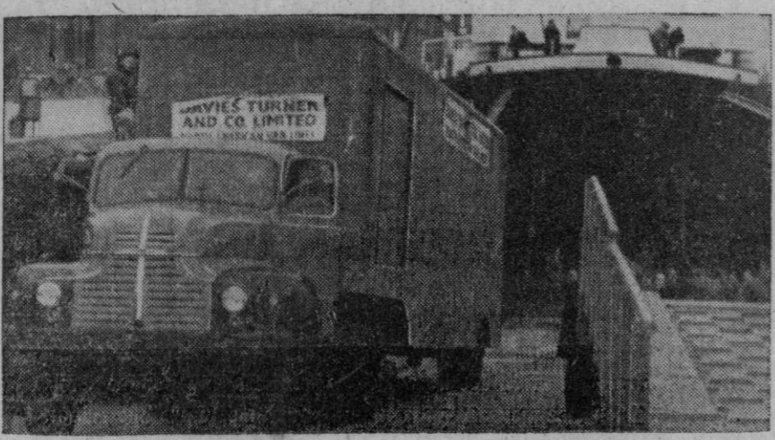
El primer camión que desembarca de los barcos de la nueva línea de transporte comercial establecida entre Inglaterra y Francia sale del Empire Shearwater—buque de desembarco de tanques, adaptado a este fin—en el puerto de Calais. Este barco puede transportar 3.300 toneladas de camiones con sus cargamentos. Debajo de cubierta tiene espacio para 50 camiones de hasta 60 toneladas, a condición de que su altura no pase de cuatro metros. En cubierta puede llevar otros 30 camiones de hasta diez toneladas

Madrid, 18.—Un eclipse parcial de luna, visible en España, tendrá lugar el próximo día 24, martes, en que habrá luna llena. El primer contacto con la penumbra se producirá a las diecisiete cincuenta y cinco horas, y el tiempo medio del eclipse, a las veinte once horas. La última fase se producirá a las veintidós veintidós horas. Debido a que el eclipse comenzará a una hora en que todavía hay luz solar, su visibilidad será escasa.