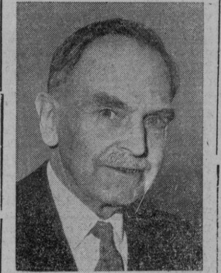
Otto Hahn, célebre sabio alemán en materia de radiactividad, galardonado con el premio Nobel, que ha cumplido 80 años de edad el pasado día 8 de los corrientes

Los encartados por este asunto, han sido puestos a disposición de la autoridad judicial.—Cifra.