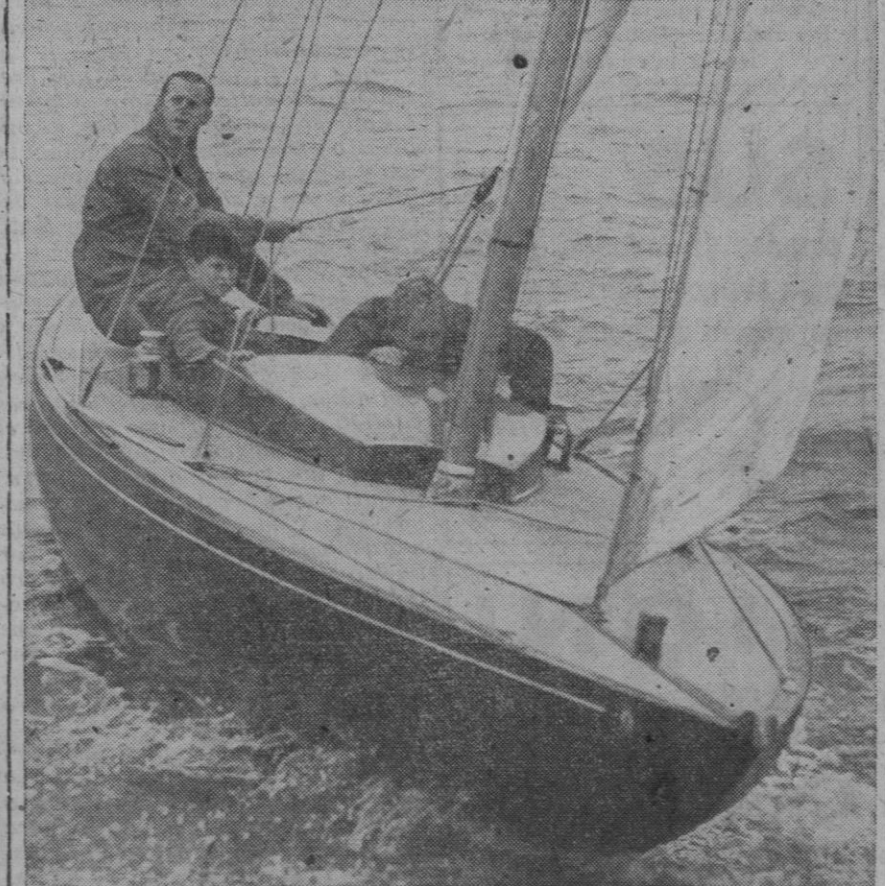
A pesar del tiempo, húmedo y ventoso, el príncipe de Gales se divirtió con gran entusiasmo durante las regatas de cuatro días del Royal Yacht Squadron, que se celebran anualmente en Cowes, Isla de Wight.

Pudieron ser salvados otros 25 caballos.—Alfil.