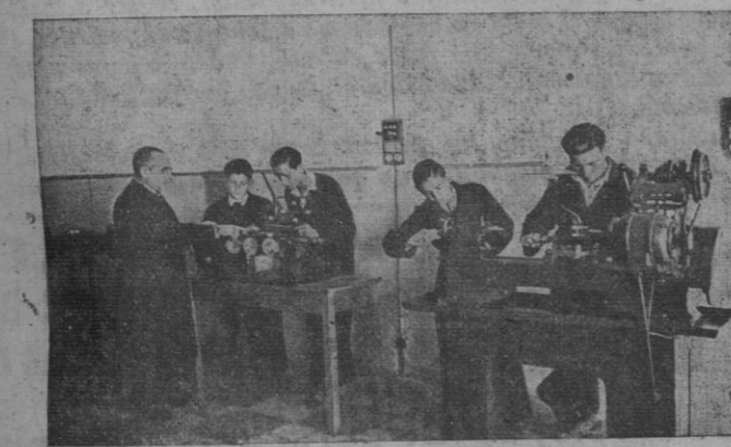
Taller de electricidad

mió el doctor Gila, fué tan notable que recibió más de setenta alumnos en la matrícula. El cuadro de profesores y maestros de taller se formó en una selección llevada a cabo escrupulosamente por el patronato mediante concurso de méritos y examen de aptitud confirmada por la superioridad, figurando entre ellos destacados profesionales en las distintas disciplinas incluidas en el plan de enseñanzas. Constituyeron éstas las de Electrotecnia, Mecánica-Ajuste y Forja, dibujo en todas sus aplicaciones, Carpintería y Ebanistería y Cerámica y Alfarería—la cual se suprimió al crearse por el Estado ésta en los Talleres Zuloaga—, Matemáticas y Cultura general, en cuanto a las lecciones teóricas. La aplicación de las enseñanzas se desarrollaban en los talleres de Electrotecnia, Mecánica-Ajuste y Ebanistería y Carpintería.