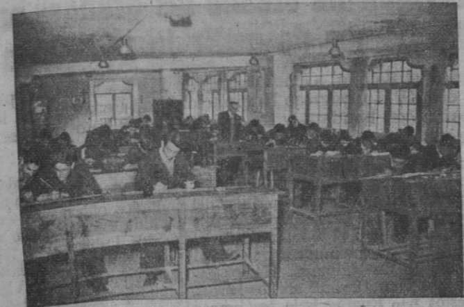
Clase de Dibujo Industrial