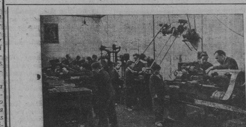
Taller de Ajustador-Matricero, Fresador y Tornero

El plan de estudios del oficial industrial, comprende en el primer curso: Matemáticas (Aritmética razonada y Geometría demostrada racional). Ciencias (Elementos de Física y Química). Tecnología (Tecnología general). Dibujo (Dibujo geométrico industrial). Prácticas de Taller (Taller del oficio). Lenguas (Redacción y lectura). Religión. Formación del espíritu nacional. Educación física. El segundo curso se aplica a Matemáticas (Álgebra y Geometría del espacio). Ciencias (Física y Química aplicadas). Tecnología aplicada al oficio. Dibujo (Croquisación e interpretación de planos). Lenguas (Redacción y Lectura). Prácticas de ta-