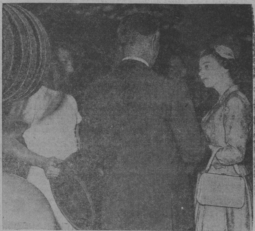
Durante su reciente visita a la fábrica de neumáticos de la India Tyre & Rubber Company, situada en Renfrewshire, Escocia, Su Majestad, la Reina Isabel II, examinó un neumático de automóvil, diseñado especialmente para carreteras de malas condiciones, en sus primeras fases de fabricación. A Su Majestad acompañó en la gira el príncipe Felipe