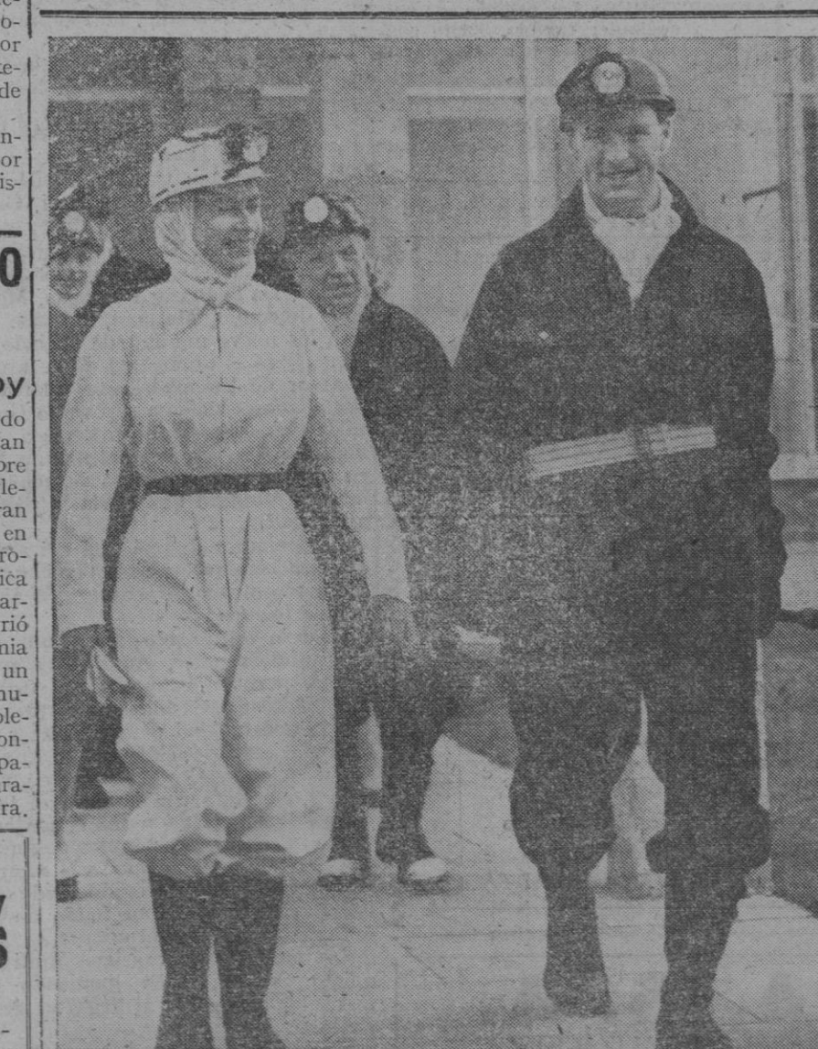
Esta fotografía recoge el momento en que Su Majestad, la Reina Isabel II, vestida de ropa de trabajo, botas y casco de minero, llega a la bocamina de la hullera Rothes, Kirkcaldy, para descender a dicha mina, durante su extensa gira por el antiguo reino escocés de Eife. Este fué el primer descenso a una mina por un monarca británico desde que Jorge V, abuelo de Isabel II, visitó una mina en 1912. Su Majestad permaneció a 480 metros de profundidad durante cuarenta minutos presenciando el trabajo de los mineros en diversas secciones de la pared de derribo, y vió el ciclo completo de cortar, barrenar y arrancar el carbón.

En virtud de un acuerdo adoptado y puesto en vigor, se han establecido notables beneficios y, concretamente en el servicio a la estación, del 50 por 100. Al mismo tiempo se han mejorado estos vehículos.—Cifra.