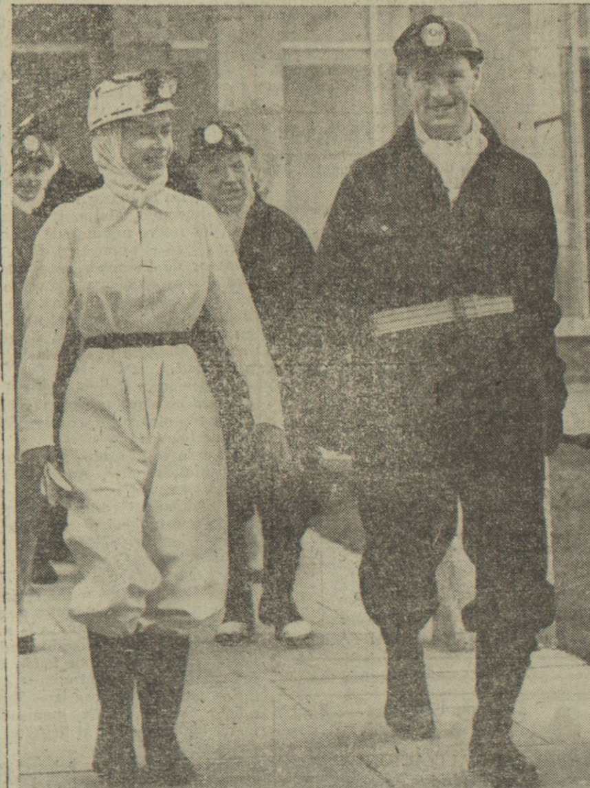
Esta fotografía recoge el momento en que Su Majestad, la Reina Isabel II, vestida de ropa de trabajo, bota y casco de minero, llega a la bocanina de la hullera Rothés, Kirkcaldy, para descender a dicha mina, durante su extensa gira por el antiguo reino escocés de Eife. Este fué el primer descenso a una mina por un monarca británico desde que Jorge V, abuelo de Isabel II, visitó una mina en 1912. Su Majestad permaneció a 480 metros de profundidad durante cuarenta minutos presenciando el trabajo de los mineros en diversas secciones de la pared de derribo, y vió el ciclo completo de cortar, barrenar y arrancar el carbón.