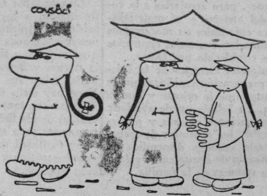
—Es un presumido. ¡Mira que hacerse permanente!

El otro día nos hablaron de un método nuevo y sencillo para quitar el dolor de cabeza. Consiste simplemente en que el paciente ande hacia atrás durante diez minutos.