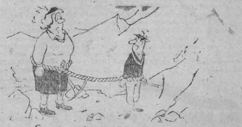
—Con esta cuerda no habrá peligro.

AMANTE DE LA NATURALEZA.—Johnny Applesed amaba a todas las criaturas de Dios. Se dice que una vez apagó su hoguera, en una noche muy fría, para evitar que una nube de mosquitos que había sido atraída por las llamas se quemase en ella. Nunca llevaba armas de clase alguna ni mataba intencionalmente ningún ser viviente, ni comía carne, pescado o aves. Desdeñaba las comodidades y sólo poseía lo que llevaba puesto.