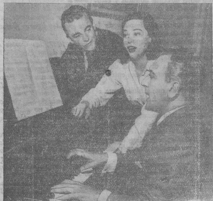
Leslie Caron junto al piano ensaya las canciones de la película "Gigi" con los compositores Alan Jay Lerner y Frederick Loewe. En dicha película trabaja Maurice Chevalier y el argumento está inspirado en una novela de Colette