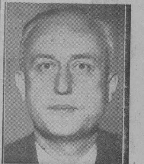
Pierre Pflimlin, nuevo jefe del Gobierno francés que tropieza ahora con la nueva crisis creada por la situación en Argelia, a la que hay que añadir la agravación de la tensión en Túnez

Se espera que los de las viviendas, excepto las construidas por las entidades públicas, aumenten en un 12 por ciento.—Efe.