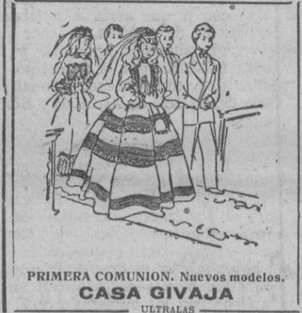
PRIMERA COMUNION. Nuevos modelos. CASA GIVAJA ULTRALAS