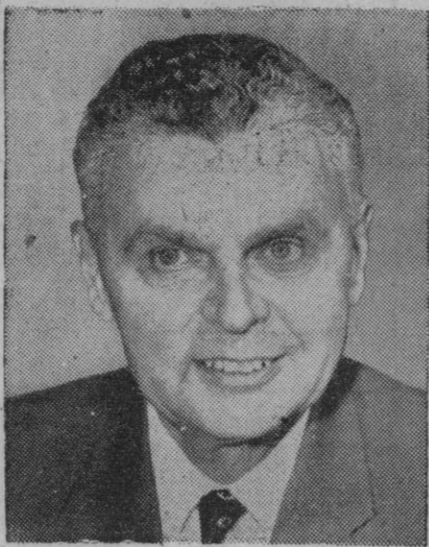
John Diefenbaker, jefe del Gobierno de Canadá, cuyo partido, el conservador, ha conseguido una victoria absoluta en las recientes elecciones parlamentarias

No puede dudarse de su lealtad en lo que toca a la integridad territorial de aquel Reino