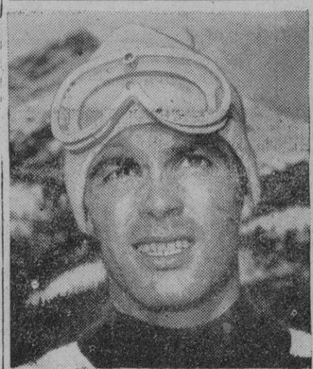
Toni Sailer, austriaco, de 22 años, quien, después de las últimas competiciones de esquí en Bad Gastein, demostró una maravillosa habilidad en el slalom y en la carrera de velocidad. Ha conseguido tres medallas de oro y acaba de ser contratado ya para el cine.