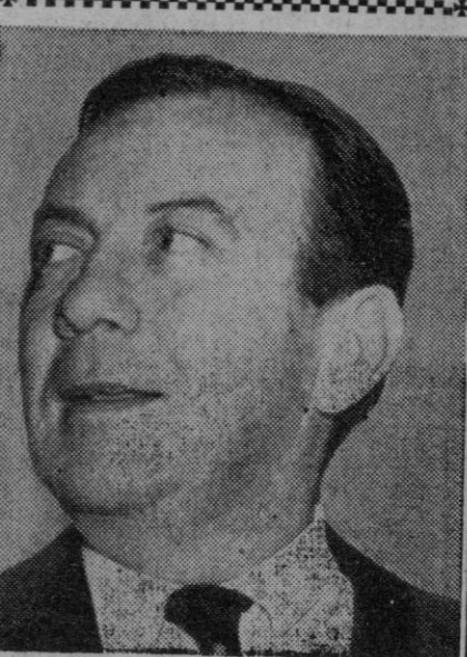
Robert F. Wagner, alcalde de Nueva York, que obtuvo la victoria sobre su contrincante el candidato republicano y fué así reelegido para el cargo

Washington, 28 (4 madrugada).—El secretario de Estado, Foster Dulles, en sus conversaciones con el Rey Mohamed V de Marruecos, se ha comprometido a continuar el auxilio económico para ayudar a dicho país a «desarrollar su economía», según se forma en un comunicado conjunto dado a la publicidad. El comunicado trata también de los siguientes puntos: