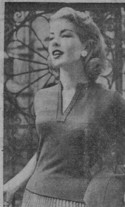
Los "sweaters" diseñados especialmente para la mujer americana constituyeron la nota sobresaliente de una exposición de modas presentada recientemente en Londres por una firma escocesa que exporta sus productos a 52 países. Uno de los más originales fue un sweater de Cachemira pura (izquierda), para vestir de noche, con mangas de tres cuartos y cuello bajo y cuadrado. Es muy elegante en negro, pero se vende también en blanco y en ocho colores, contándose entre ellos los nuevos tonos de sandía y visón plateado. Otro de los sweaters exhibidos, de lana de cordero australiano Geelong (centro), tenía el cuello en forma de herradura. Este artículo se fabrica en varios atractivos colores, incluso de rosa alpina y castaño de tonalidad de miel, y posee la ventaja de ser inatacable por la polilla. Para la mujer que busca una nueva variación de la popular combinación de sweaters-chaleco de punto, se exhibió un juego muy a la moda (derecha), consistente en un sweater de manga corta y cuello en forma de V con vivos horizontales y un chaleco de manga larga con botanadura hasta el cuello.