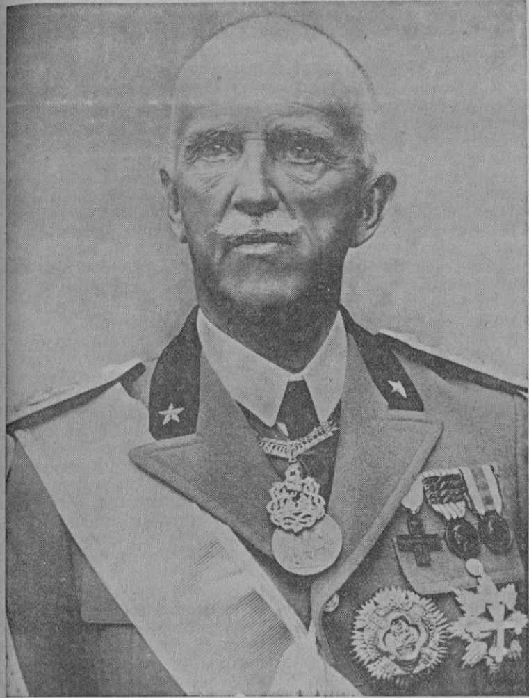
Su Majestad el Rey de Italia, Emperador de Etiopía y Rey de Albania