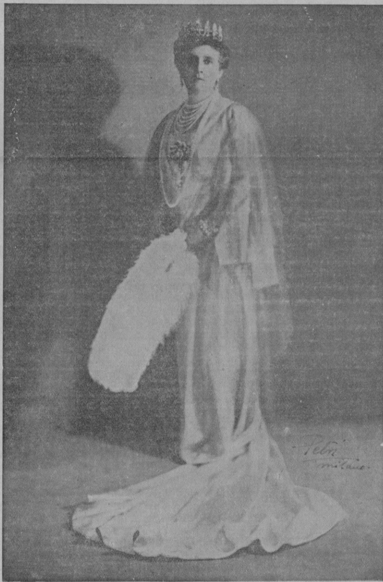
Su Majestad la Reina de Italia, Emperatriz de Etiopía y Reina de Albania

Como quiera que durante un buen rato, continuasen oyéndose los gritos de adhesión del gentío, el Caudi-