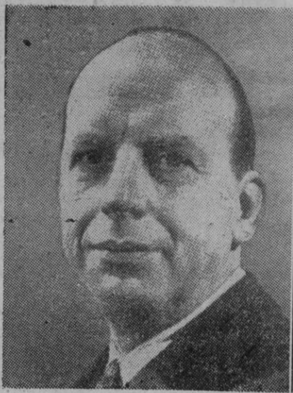
Herbert Brownall, ministro de Justicia de los EE. UU., que combatió al gobernador de Arkansas, Faubus, quien prohibió llevar a cabo la integración racial en las escuelas de Little Rock

Elevarán sus dictámenes a Gobernación en el plazo de un mes